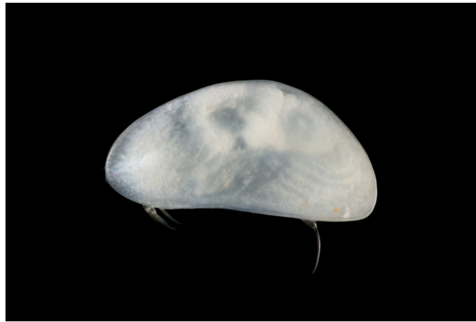
Spécimen sub-adulte de la nouvelle espèce Candonopsis danilucae (J.-F. Cart / SEPANSO) - Taille env. 500 \mu m

Première nouvelle espèce officiellement décrite et publiée dans le cadre de l'Inventaire Stygofaune en Nouvelle-Aquitaine